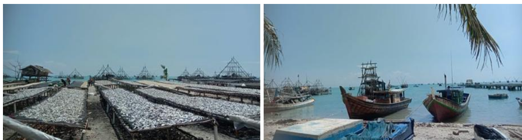
Gambar 2. Kegiatan Mata Pencaharian Masyarakat Desa Batu Belubang