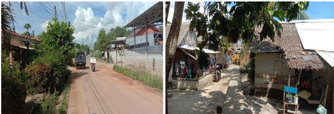
Gambar 4. Kondisi Permukiman Masyarakat Desa Batu Belubang