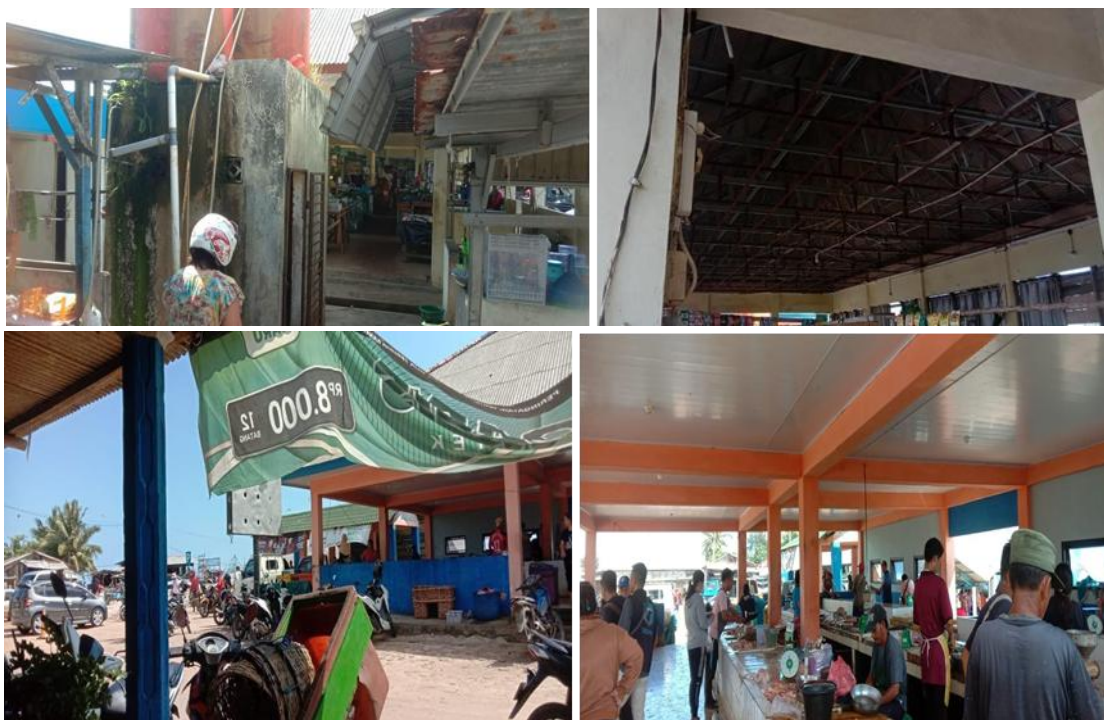
Gambar 3. Kondisi Pasar Desa Batu Belubang

Akses untuk di daerah batu belubang ini cukup merata dan bisa dikatakan baik tapi di sebagian jalan di batu belubang kurang memadai seperti akses ke pasar tradisional nya di area pintu masuk dan di tempat pasar nya juga harus diperhatikan karena ada jalan yang harus diperbaiki. Untuk fasilitas pasar nya sudah cukup baik, namun harus diperhatikan di bagian pemeliharaan pasarnya karena ada si sebagian gedung pasar yang kurang layak dan harus diperhatikan dari pemerintah setempat agar masyarakat nyaman dan pengunjung tertarik untuk berbelanja di pasar batu belubang.