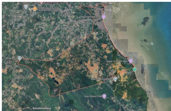
Gambar 1. Lokasi Desa Batu Belubang

Desa Batu Belubang adalah salah satu desa yang berada di Kecamatan Pangkalan Baru, Kabupaten Bangka Tengah, Kepulauan Bangka Belitung. Desa ini berjarak sekitar 11 km dari Pangkal pinang. Batu Belubang merupakan nama sebuah desa yang berasal dari sebuah batu di pinggiran pantai. Batu ini dulunya memiliki lubang yang mirip pintu masuk sebuah gua. Namun kini, batu tersebut mulai tertimbun tanah. Letaknya di pinggir jalan menuju kawasan wisata Pantai Tapak Antu. Batu Belubang resmi menjadi desa definitif pada Mei 2007 lalu. Sebelumnya wilayah ini merupakan bagian dari Desa Benteng dan Desa Tanjung Gunung.